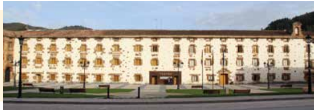
La Real Fábrica de Santa Bárbara