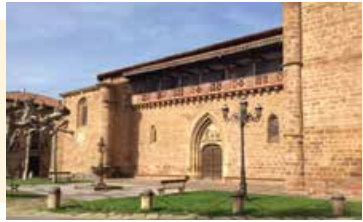
Iglesia de Santa María La Mayor