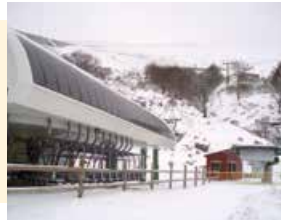
Estación de Esquí "Valdezcaray"