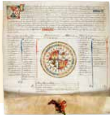
Fuero de Valle