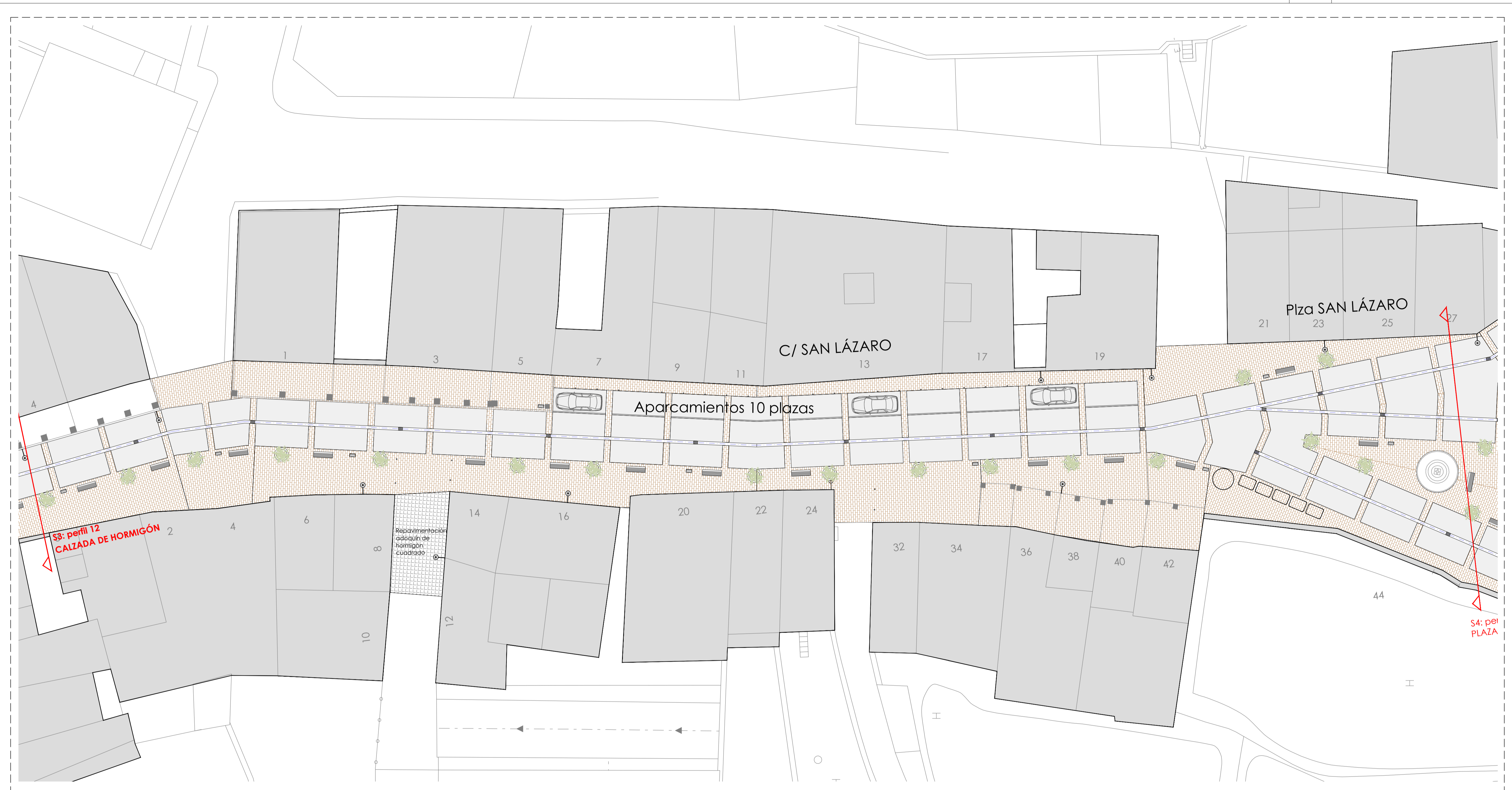
AREA DE INTERVENCIÓN 3 C/ San Lázaro del 1 al 35